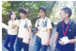
学生メンバーは最少の3人