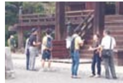
観光客にもインタビュー