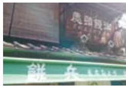
旧東海道沿いには古いお店が