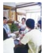
ほっと すていしょん