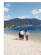
白砂青松の 近江舞子浜