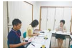
ゆめっこにて所長のお話