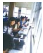
びわ湖パレイ山頂