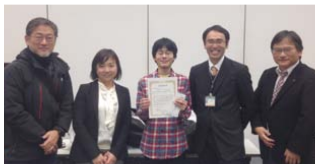
脇田教授(左)と発表者