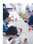
社員さんの話を伺う