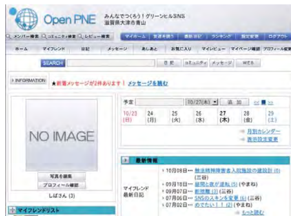
地域住民にソーシャル・ネットワーキング・サービス (SNS) を提供

本活動は、行政やNPO、市民団体と協働し、地域コミュニティの形成や活性化を、情報システムの活用によって支援することを目的としています。特に、Webサイトやソーシャル・ネットワーキング・サービス (SNS) などのサービスを提供したり、これらの使用方法を学べる場を提供したりする活動を行っています。